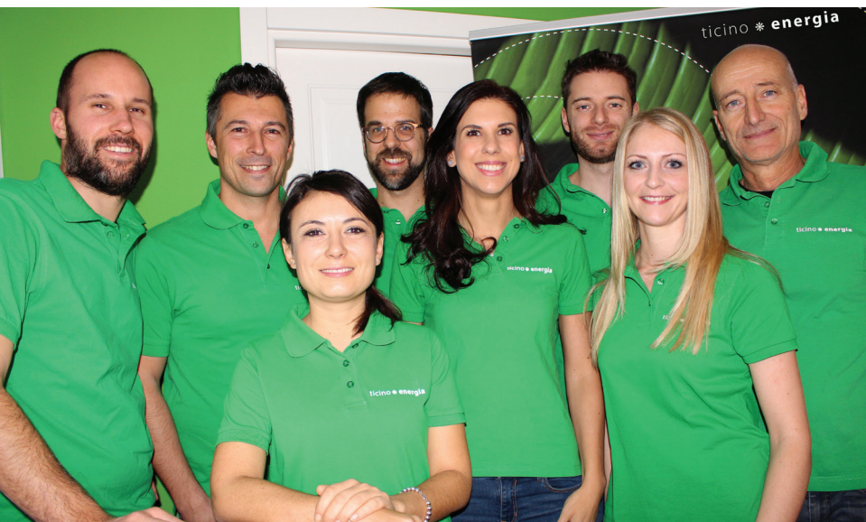
◀ Il team TicinoEnergia.

Conformemente ai suoi compiti, TicinoEnergia svolge, in occasione della prossima edizione di Edilespo, il ruolo di coordinatore per l'organizzazione dello stand istituzionale del Dipartimento del territorio, dove è presente insieme ai partner Energia Legno Svizzera, Federlegno, Geoermina Svizzera, SvizzeraEnergia e Swissolar.