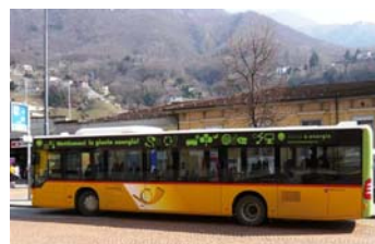
Autopostale Bellinzona e Valli