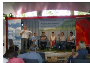
Festival basecamp09 - Aperitivo scientifico «Energia per il pianeta» - 27.05.2009