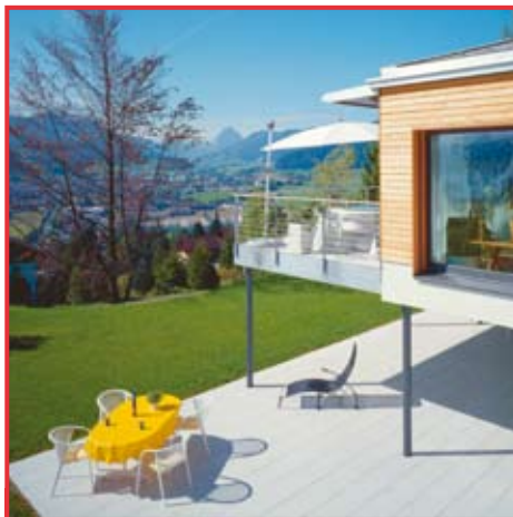
Una casa MINERGIE® conserva a lungo il suo valore. (SZ-015)