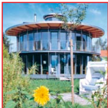
Con MINERGIE® tutto è possibile, anche in pianta. (SG-162)