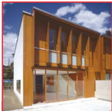
MINERGIE® lascia libertà di scelta nella forma e nei materiali. (TI-015)